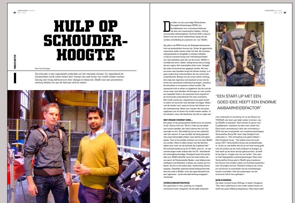
De afbeeldingen zijn illustraties van de inhoud van de magazinepagina's.